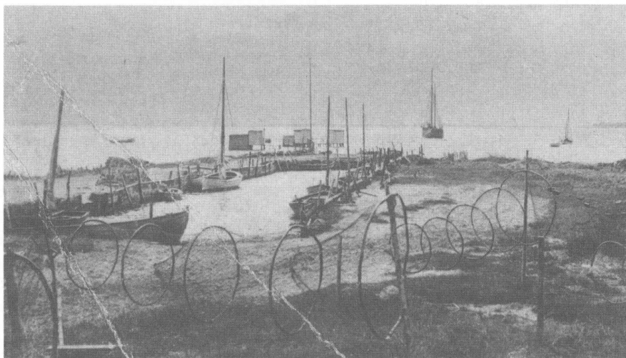
Havnen i Falsled kort efter århundredskiftet.

til at ligge i havnen, så de lå i Assens og Kerteminde. Der boede ca. 50 søfolk i