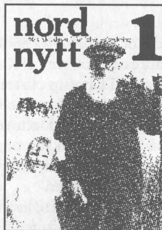
T.v. en forside fra Nord Nytt, da det blev duplikeret i 1960'erne. Th. det første nummer i den nye serie i 1978.

sesplanen. Man udgav dobbeltnumre, hvilket hjalp lidt. Men da man til sidst var flere år bagefter, strandede udgivelsen i Stockholm, hvor man udgav et enkelt nummer i 1976. Tidsskriftet var faktisk gået ind.