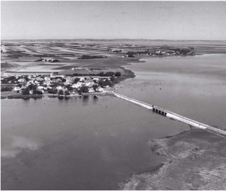
Luftfotoet fra 1956 viser bro og dæmning over den lavvandede bredning.