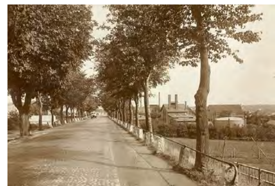
Figur 7. Silkeborgvej ved Åbyhøj havde i 1925 det udbredte sikkerhedsrækværk med jernrør fastspændt på store sten.

I længden kunne patentet ikke beskytte DAV. Blandt andet markedsførte firmaet Nordisk Autoværn i 1960'erne et autoværn i beton, som dog havde to vandrette bjælker.