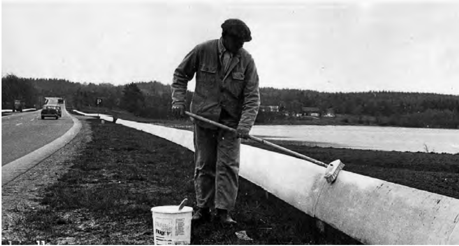
Figur 3. Maling af autoværn hører med til den jævnlige vedligeholdelse.

Autoværnene solgte dog ikke sig selv, så der skulle informeres om produktet. Han havde i 1939 fået vejmyndigheder til at sætte autoværnet op ni steder, og nu var tiden moden til for alvor at gøre folk opmærksom på produktets værdi. Han fik tilladelse til at opsætte autoværn ved en jernbaneoverføring i Helsingør, hvor en ret stejl vej førte ned til Færgevejen. En lang række af landets eksperter var indbudt til at se forsøg med påkørsel med både personvogne og lastbiler. "Man føler sig usikker og frygtløs, når der køres langs en række granit- eller betonstolper, men langs et autoværn vil man føle sig tryk." lød en bedømmelse fra en af tilskuerne.