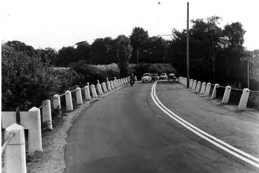
Figur 2. En mere moderne udgave af sikkerhedsrækværk havde erstattet kampesten med betonstøbte piller. De udgjorde dog stadig en stor fare ved påkørsel, som her ved overføring af jernbane i Sct. Jørgensgade i Odense i 1971.