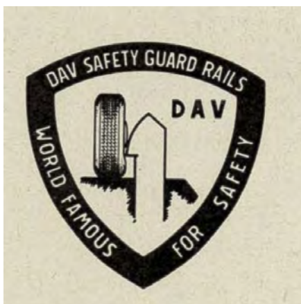
Figur 1. Firmaet Dansk Auto Værn markedsførte autoværnet internationalt med dette bomærke i 1960'erne. Tegningen symboliserer autoværnets evne til at rette vildfarende køretøjers retning.

værkets sten var skyld i mange uheld. Rasmussen byggede sit sikkerhedsrækværk i beton – hvide betonbjælker på pæle, som vi kender dem fra mange danske veje i dag. Betonbjælkerne havde en buet profil for at kunne rette en bils forhjul op, så bilen ændrede kørselsretning væk fra afgrunden.