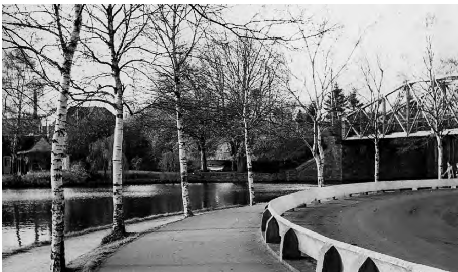
Figur 4. Nogle af de første autoværn blev opsat i DAV's hjemby, Silkeborg, som dette i et sving ved Sejsvej.