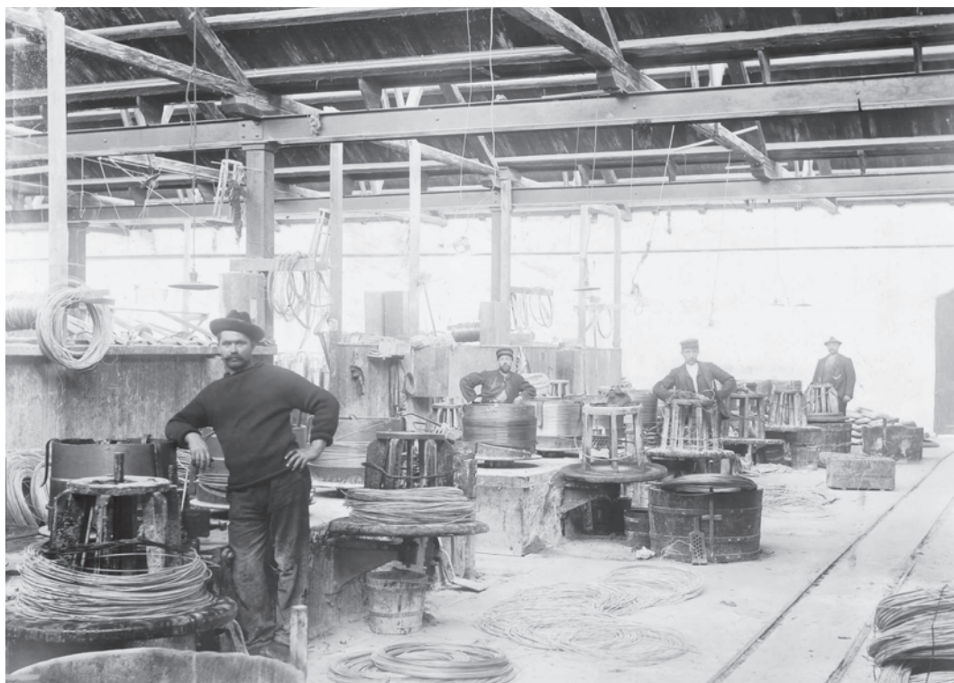
Der var mange gentagne arbejds momenter på 'trækkeriet' på NKT's fabrik, hvorfor der blev indført tidsstude-rede akkorder o. 1911. Tidsstudierne blev imidlertid afskaffet få år senere for at blive genindført et halvt århun-drede senere (billede fra o. 1905).

En arbejder kunne imidlertid aldrig nå op på den teoretiske ydeevne, fordi han skulle holde pauser, vente på materialer etc. Men tidsstudierne blev et praktisk redskab, som arbejdstilrettelæggerne kunne bruge for at reducere de uproductive perioder.