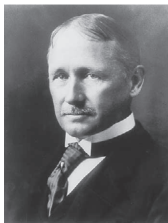
Amerikaneren Frederick Winslow Taylor (1856-1915) blev den, som sammenfattede den nye tidsidéer om ledelse, Scientific Management. Taylorisme kaldte hans disciple dem også.

Et vigtigt hjælpemiddel var de såkaldte tidsstudier, der kunne benyttes, når akkorden skulle fastlægges. Tidsstudierne var den videnskabelige måling, hvor det nye hjælpemiddel, stopuret, kunne måle meget korte tidsperioder. Herved kunne et arbejde blive opløst i sine enkelte bestanddele. Ved at lægge de enkelte tidsdele sammen fik man den maksimale teoretiske ydeevne.